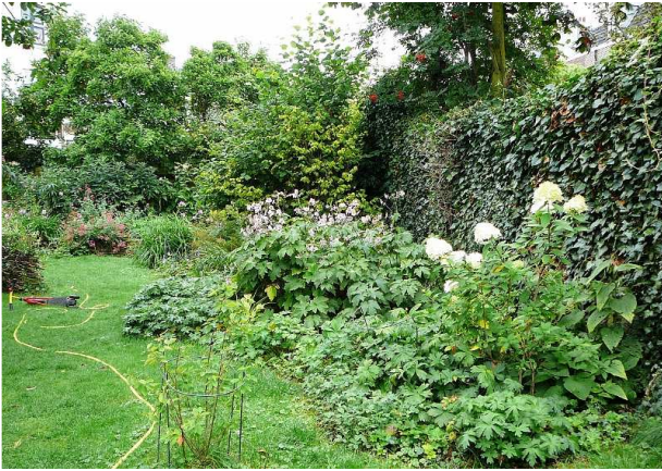
Voorbeeld binnentuin Bikkershof – Bekkerstraat, Utrecht

De overgang tussen brandgang naar gemeenschappelijke tuin wordt aangegeven door de achterburen dat het de voorkeur heeft om deze laag te houden.